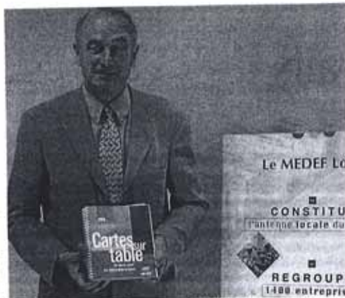
Le président du MEDEF Loire enverra la publication à une centaine de décideurs ligériens.

Le monde change et ses acteurs se doivent d'en tenir compte. Annuellement, le MEDEF édite "Cartes sur table", un document qui propose un état des lieux analysant la situation économique globale et ouvre les perspectives qui, selon le mouvement patronal, doivent être dégagées pour repenser le fonctionnement du système. Une mine exhaustive d'informations destinées aux décideurs, chefs d'entreprises politiques, collectivités, enseignants, et que le grand public peut consulter en ligne sur le site www.medef.fr . Sous l'intitulé "Un monde inédit : une chance pour la France" le livret consciencieusement rubriqué et accompagné de graphiques s'appuie sur des statistiques objectives fournies par les principaux organismes internationaux référents. Ou il ressort qu'une dynamique exceptionnelle est en cours, avec une phase d'ex-